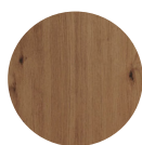
KORPUS Artisan Eiche Nachbildung

Metalleiste zur Verschraubung der Arbeitsplatte