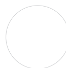
FRONT Weiß Hochglanz