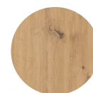
FRONT Artisan Eiche Nachbildung