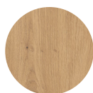
KORPUS Artisan Eiche Nachbildung

Metalleiste zur Verschraubung der Arbeitsplatte